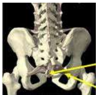
Coccygeus muscle Coccyx Sacrospinous ligament